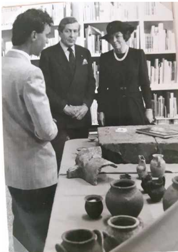
Afb. 7. Rondleiding over gelegenheidstentoonstelling ‘Satricum’ in Nederlands Instituut te Rome, maart 1985

Romeinse campagna . Bovendien al veel eerder ontdekt en leeggeschept, eind 19de eeuw. De spectaculaire vondsten van toen, immer onuitgegeven, hadden al twee aparte zalen in de Latium-tentoonstelling gevuld (afb. 4). Weliswaar bevestigde de brief het aanbod om onderzoek uit te voeren, maar ook werd verwezen naar de officiële weg. Het NIR moest een wettelijke vergunning bij de autoriteiten aanvragen, die zou dan van harte ondersteund worden, maar er moest ook een prehistorisch specialist in het team. Dat was in 1976. Inmiddels weten we dat er in dat comité felle discussies over waren gevoerd. Satricum voor de Nederlanders? No way! Hoe dat ook zij, het jaar daarop werd een eerste schoonmaakcampagne uitgevoerd, met medewerking van onder meer dezelfde Maaskant en Galestin. Die gingen later op een deel van de akropolis met hun team van de Rijksuniversiteit Groningen een geheel eigen weg, terwijl het NIR de hoofdcampagnes bleef uitvoeren, daar en elders in het stadsgebied (afb. 8). In de loop der tijd ontwikkelden die NIR-activiteiten zich van bescheiden schoonmaakcampagnes van de ruïnes op de stadshoofd naar een strengste verboden was de grond in te gaan – alleen struiken wegknippen! –, tot volledige, meervoudige en soms maandenlang durende