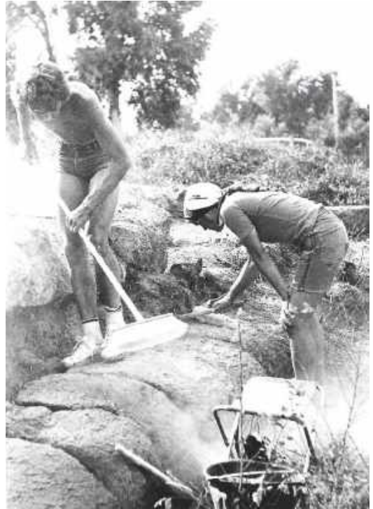
Afb. 8. Tweede schoonmaakcampagne op de akropolis van Satricum, september 1978