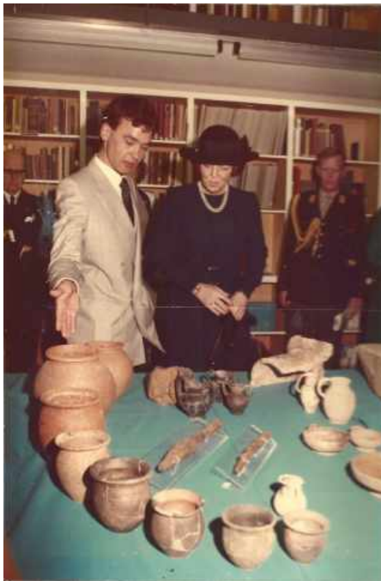
Afb. 9. Rondleiding overgelegenhedstentoonstelling 'Satricum' in het Nederlands Instituut te Rome, maart 1985

Het NIR was in 1904 opgericht als uitvalsbasis om de nationale Nederlandse geschiedenis en identiteit te verrijken met bronnen uit vooral het Vaticaan, dat toen net was gereduceerd tot nog geen halve vierkante kilometer en nijver broedde op nieuwe geopolitieke zingeving. Het NIR heeft altijd vooral wetenschappelijke activiteiten uitgevoerd. Het