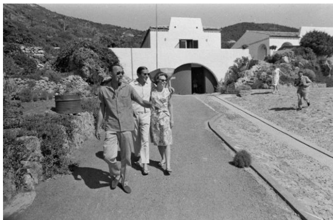
Afb. 6. Prins Bernhard en koningin Juliana (rechts achter) met oudste dochter en nieuwe verloofde, voor hun villa ‘De Gelukkige olifant’, Porto Ercole, juli 1965