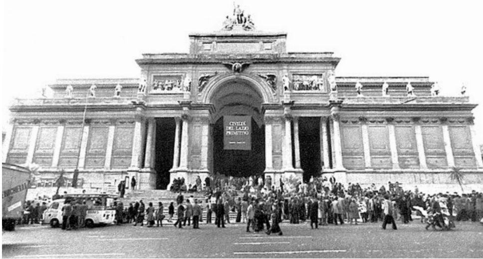
Afb.2. Palazzo delle Esposizioni Roma tijdens tentoonstelling Civiltà del Lazio primitivo , voorjaar 1976