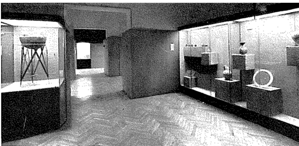
1, 2. - I nuovi scavi di Decima con le ricche suppellettili del VII secolo ; 3. - Tombe di Satricum