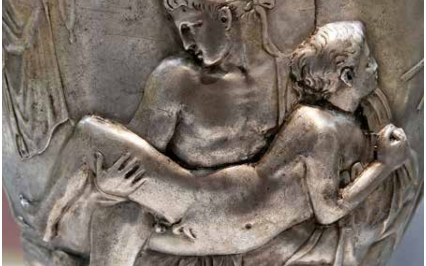
The 'Warren Cup', B-zijde, detail.

I discuss here a few aspects of how research into the history of sexuality can be mobilised for public impact, and the museological, institutional, cultural and political issues that can be at stake in such issues. I describe the evolution of a British Museum project on LGBT history across world cultures, as I experienced it personally as its lead curator; I let readers draw their own conclusions from this account.