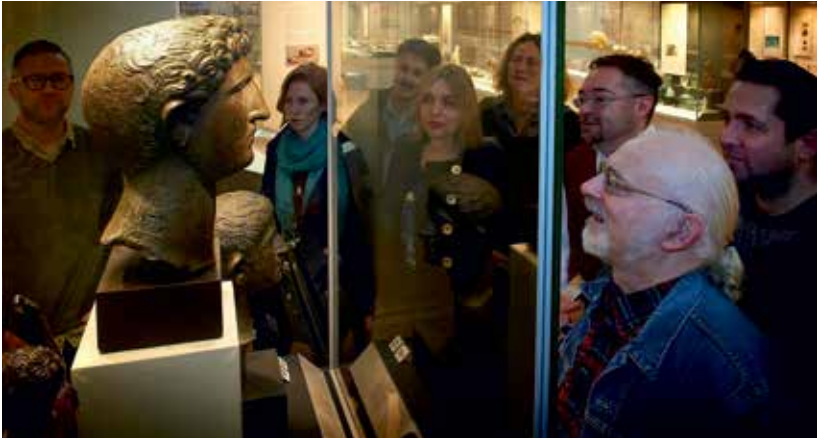
Visitors looking at Hadrian in 2012.

the emperor mourns the drowned Antinous while the imperial entourage is in Luxor, and he visits a famous statue of an ancient pharaoh, which was a tourist site because it seemed to sing at dawn. Instead of leaving yet another official inscription, he simply carves his name in Greek, Adriano, a single word as 'a life sum (of which the innumerable elements would never be known), a mere mark left by a man wholly lost in that succession of centuries'. [5] Yourcenar based this episode on the official inscriptions on the statue recording the emperor's visit, but there are in fact none with only his name. Here the scholarly Yourcenar re-wrote the historical evidence, making her hero subvert the state monument with a small sign of the importance of the inner world of an individual, independent of all official history. The novel is a masterly example of how history can be written from a non-normative perspective. Yourcenar had visited the British Museum