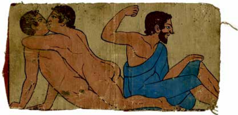
Tekening op papier (na 1827) van een wandschildering uit de Tomba delle Bighe, Tarquinia, grafveld Monterozzi, ca. 490 v.Chr., verwoest in 1949. British Museum, inv.nr. 2010,5006.610. 12 x 24 cm.