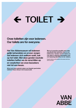
Gender-neutraal toilet | van Abbemuseum

te zitten, maar kan ook op activiteiten staan. Zorg bijvoorbeeld dat ook mannen welkom zijn bij activiteiten die vaak alleen voor vrouwen georganiseerd worden, en andersom.