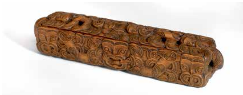
A Maori treasure box depicting oral sex.

lovers. As with Niankhkhnum and Khnumhotep, the evidence as a whole suggests strongly that they were twins. Their stela is on public display in a permanent gallery (Room 61), but there is simply not enough space there to address the question of their sexuality in a gallery that covers some three thousand years of elite and non-elite social life. A web-trail based on the permanent displays, however, allows specific aspects to be explored in more depth, and the museum's online database of the collection allows a fuller treatment of the objects than a brief label. In the database, the LGBT hypothesis can be – and is – fully referenced ( britishmuseum.org/research/collection_online/search.aspx ).