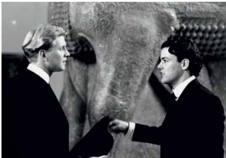
Two lovers in the British Museum from James Ivory's Maurice.

I wanted to include film as an art form wherever possible in the book, and so we approached the legendary Merchant Ivory Productions who had filmed the novel on location in 1986, and James Ivory generously offered a range of stills. We used three of these in the book, including an unpublished shot of a deleted scene in the Egyptian sculpture gallery, which particularly appealed to me both as an Egyptologist and as a gay man (p. 28, 90, 123). A photograph of James Ivory filming among the Egyptian statues signals the role that museums can play as a stage for living art, connecting the past and the present, and legitimising it. In my opinion Maurice is the greatest of all LGBT films, not only because it is without stereotypes, but also