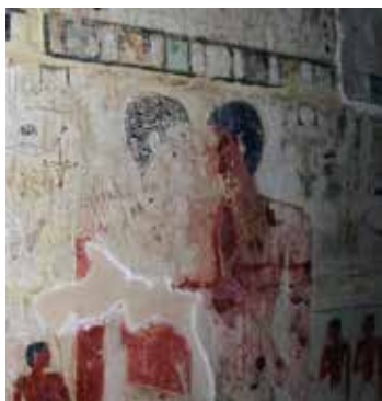
Two ancient Egyptians embrace in their tomb at Saqqara.

I myself am not a historian of sexuality, but simply a gay Egyptologist who specialises in Middle Kingdom literature from around 1900–1650 BC. The poetry of this period arguably articulates ideologically non-normative themes. This poetic corpus preserves the earliest known chat-up line in human history, which happens to be one between two males: ‘What a lovely backside you have’. In 1995, I discussed some of these themes in an article on same sex desire in Middle Kingdom poetry.