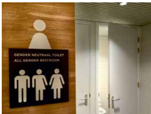
Gender-neutraal toilet | Amsterdam Museum

Beleg queeren in je organisatie bij meer dan de usual suspects Probeer niet alleen de projectmedewerker die het queeren gaat uitvoeren mee te krijgen, maar zorg voor breder draagvlak. Laat de directeur publiekelijk het project omarmen, in plaats van die ene bekende gay conservator. De kans van slagen stijgt er enorm door. Bereid collega's voor op het project, discussieer er met ze over en laat ze meedenken.