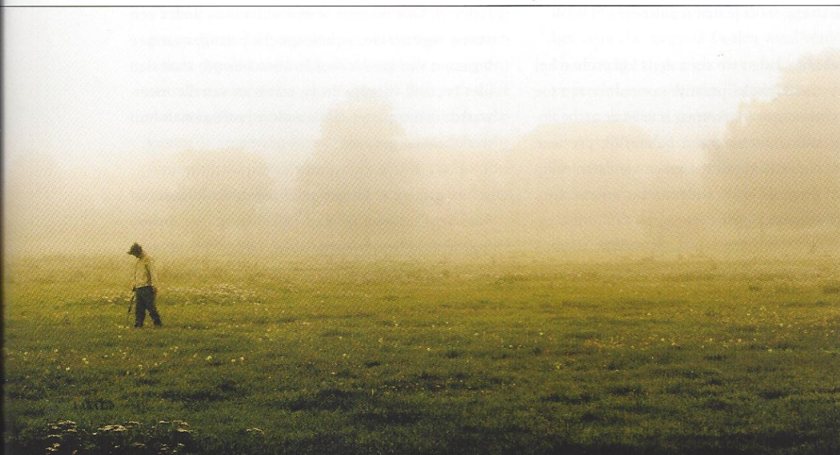
Hobbyisten met metaaldetectoren vinden geregeld objecten uit de Tweede Wereldoorlog die vlak onder het aardoppervlak begraven liggen.

Nationaal versus historisch belang | De vraag die de roep om actieve bescherming opwerpt, is wat je – lees: ‘de overheid’ – moet regelen en wat je met een gerust hart aan het vrije spel van maatschappelijke krachten kunt overlaten. De overheid gaat immers niet over herinnering als zodanig, wel over het veiligstellen van plekken die van nationaal belang zijn. De bescherming van vindplaatsen uit de Tweede Wereldoorlog wordt in die context gemotiveerd door beleving. Andere criteria voor wettelijke bescherming, zoals de gaafheid en de mate van intact zijn van een vindplaats, voldoen in dat geval meestal niet. Ook is het wetenschappelijke (historische of architectonische) belang van deze vindplaatsen gering, want ze dragen weinig bij aan algemene kennis van de gebeurtenissen of omstandigheden uit die periode. Geen periode in ons land, heet het, is immers zo goed en systematisch gedocumenteerd als de jaren ‘40-’45.